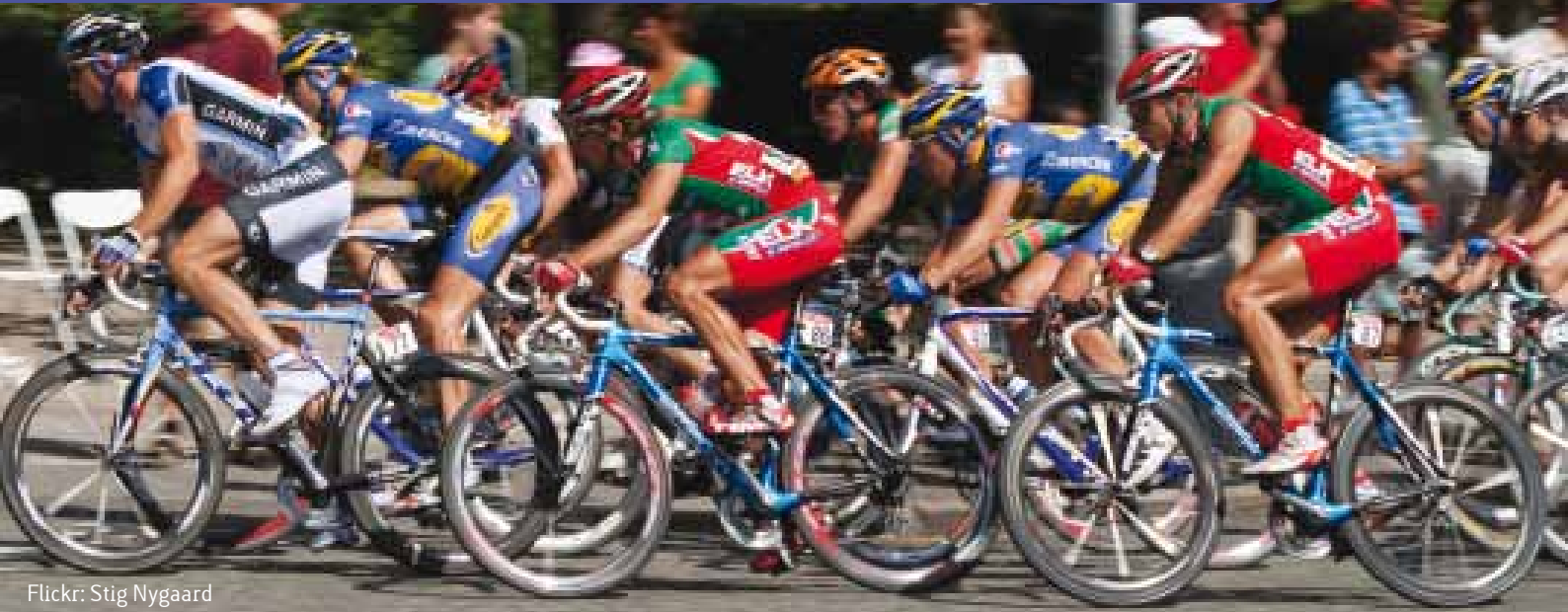
Flickr: Stig Nygaard

Talent, ambitie en engagement vormen de basis, maar investeren in topsport is een must om te kunnen concurreren in de mondiale medaillewedloop. Zonder een gestructureerd topsportbeleid op verschillende niveaus dreigt men tussen de topsportlanden te verdwijnen. Daarom is het belangrijk om, als men wil blijven meestrijden op het hoogste niveau, het gevoerde beleid steeds opnieuw te evalueren en te vergelijken. Door de verschillende belangengroepen uit het topsportlandschap in Vlaanderen te ondervragen, kunnen de ontwikkelingen en verwachtingen blijvend in kaart gebracht worden. In dat opzicht voert VUB, in samenwerking met het Bloso, BOIC en het departement CJSB, in 2011 en 2012 een onderzoek naar het topsportklimaat. Doelstelling: de omgeving waarin de topsporters zich ontwikkelen verbeteren.